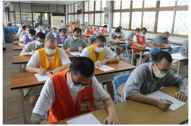
8. 專注安靜作答情景