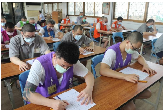
7. 專注安靜作答情景