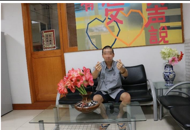
同學以手勢表達對母親的愛