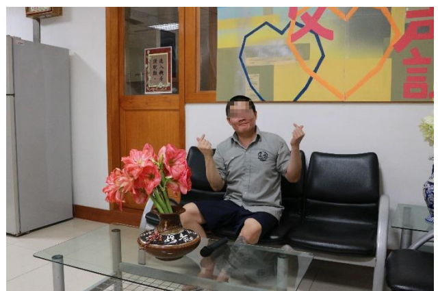
真情流露對母親的愛