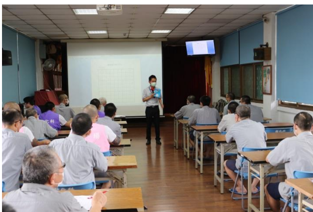
由同學抽籤數獨題目