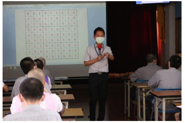
公布解答核算得分