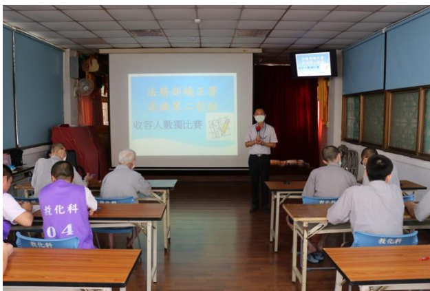
教誨師說明比賽規則

為鼓勵收容人從事正當休閒活動，並從競賽中培養積極進取精神，本監於 109 年 7 月 16 日舉辦「收容人數獨比賽」。「數獨」，規則簡單易懂，但數字方格組合排列卻千變萬化，本次比賽由各場舍遴選二人組隊參賽，所有參賽同學無不絞盡腦汁認真解題，無形中培養同學的專心、靜心及耐心並提昇邏輯思考能力，比賽結果由教化科、炊場及第七工場分別榮獲前三名。