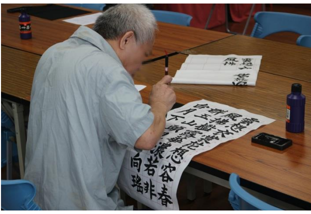
一字一句完成字帖