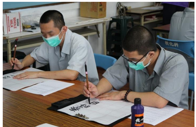
比賽過程耐心琢磨