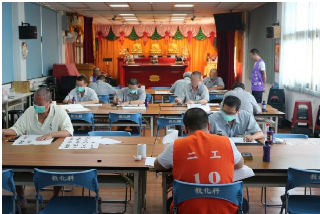
在佛堂莊嚴的環境比賽