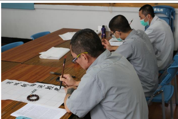
屏氣凝神專心投入