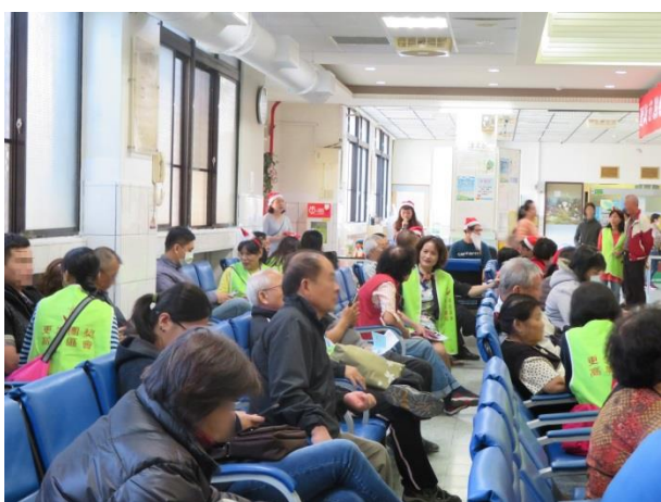
志工伙伴將愛與關懷傳遞給接見家屬