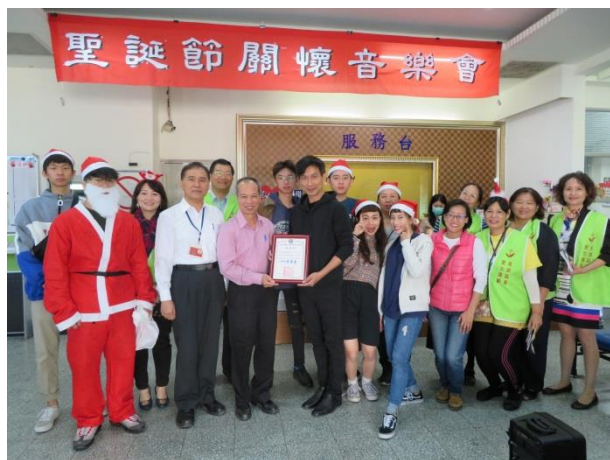
副典獄長代表頒發感謝狀與志工合影