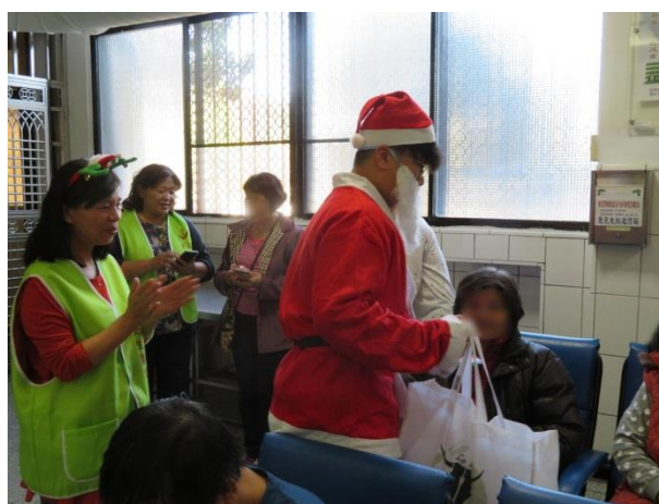
裝扮聖誕老公公發送有獎徵答禮物