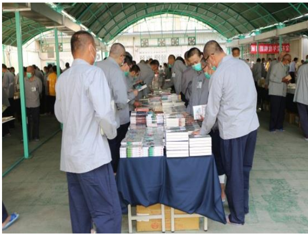
徜徉書海中飽覽金石堂排行榜好書