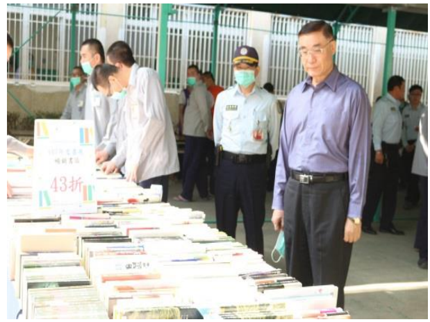
典獄長到活動會場關心書展景況