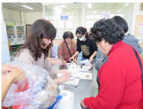
志工帶領接見家屬手做薑餅人DIY教學