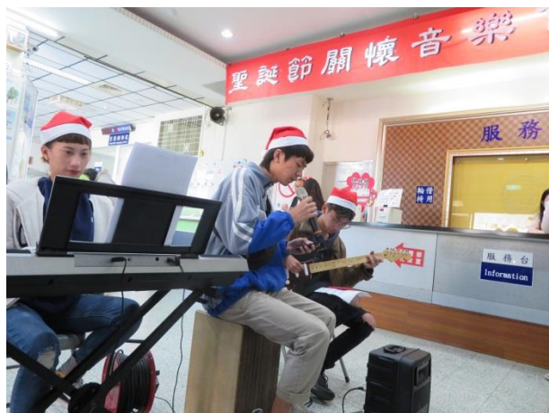
更生團契星沙教會志工演唱聖誕音樂組曲