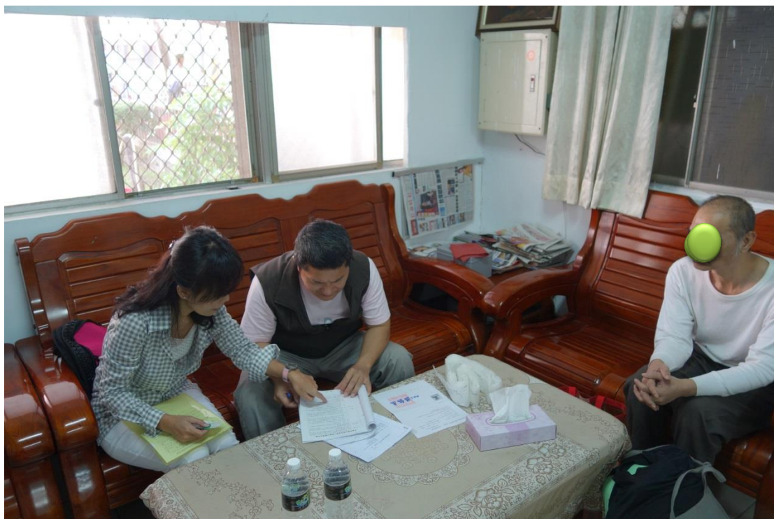
高雄第二監獄派員與安置機構親洽轉銜，使出監人境況與需求得以無縫接軌。