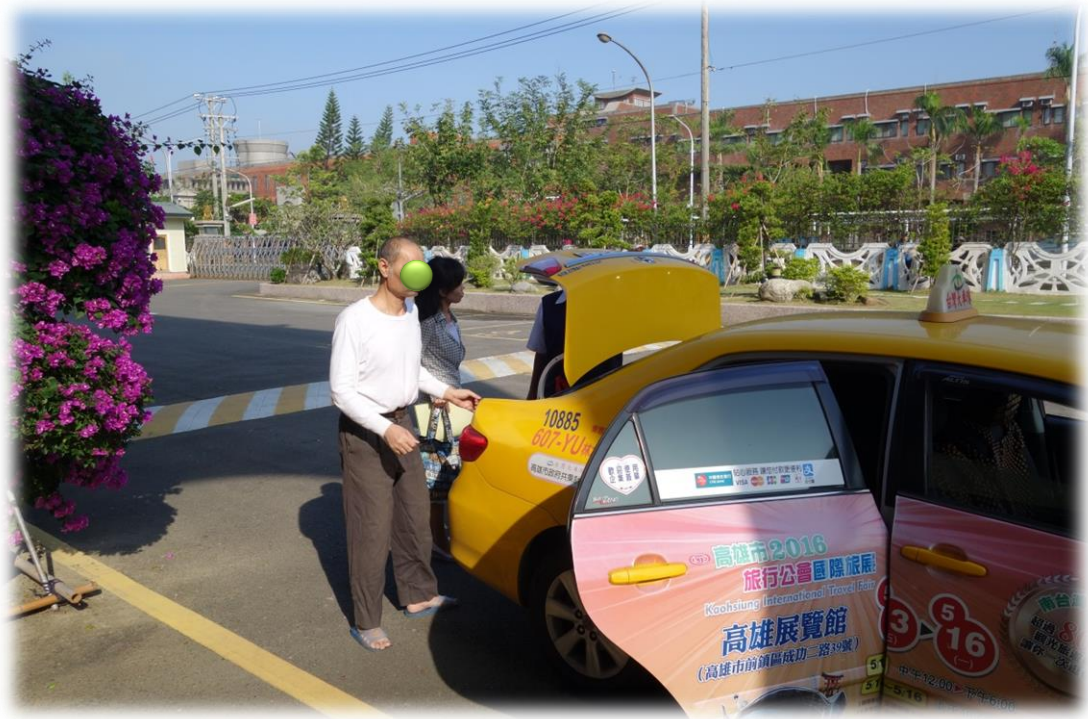
高雄第二監獄派員護送出監人至安置處所收容