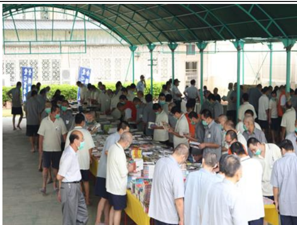
來到書展徜徉於書海中