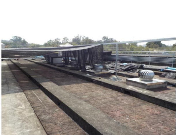
德舍頂樓遮陽網施作情形