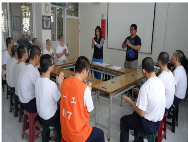
成癮概念及戒癮策略