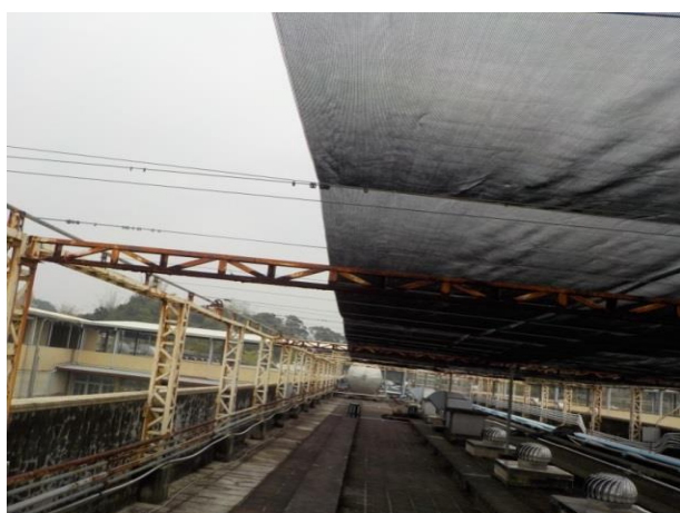
正舍頂樓遮陽網施作情形