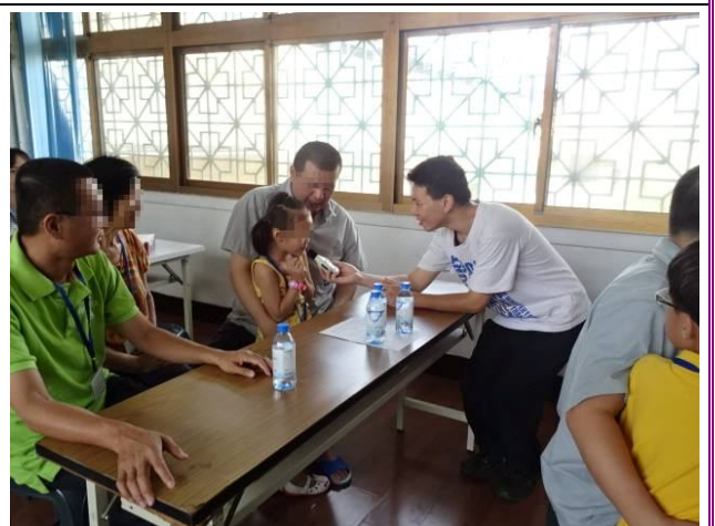
大聲說出「媽媽，我愛你」