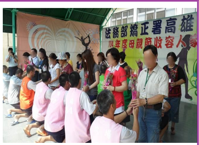
愛的獻禮—獻上最深的祝福