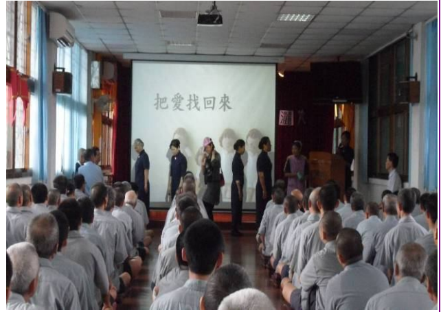
安裝電視播放教化成果影片