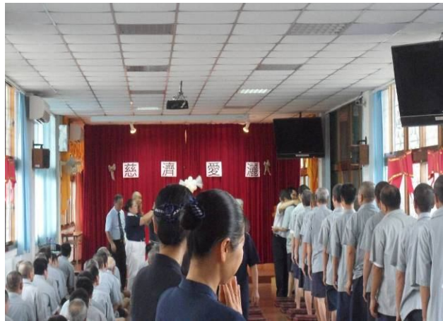
活動結束前盧教授一一與現場同學擁抱祝福