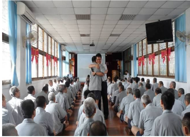
盧教授以擁抱方式回應分享回饋之收容人